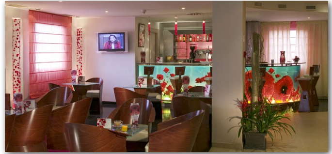
AVDA. SAN MARTÍN DE VALDEIGLESIAS, 4 / 28922 - ALCORCÓN

El ibis hotel en Alcorcón Tres Aguas está a 15 minutos del Centro de Madrid en transporte público. Igualmente, se encuentra a 7 km del Recinto Ferial de la Casa de Campo , el Zoo y el Parque de Atracciones.